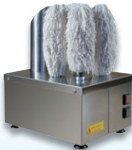
GLASS SHINING MINI